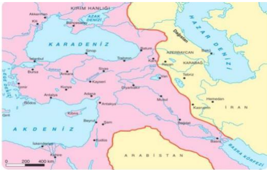
Kasr-ı Şirin Antlaşmasına Göre Osmanlı - Safevi Sınırı