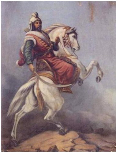
Sultan Murad IV. Sultan Murad IV.