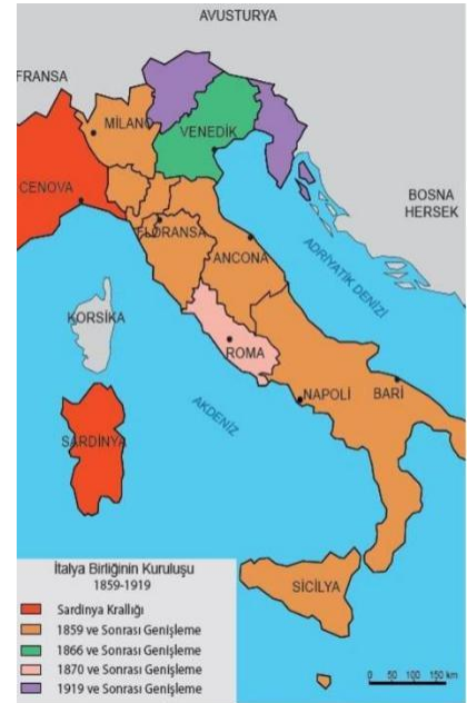
XIX ve XX. yüzyılda İtalya birliğinin kuruluşu

DİKKAT: İtalya, siyasi birliğini kurduktan sonra sömürgecilik hareketlerine başladı. Kısa zamanda Avrupa politikasında söz sahibi devletlerden birisi oldu.