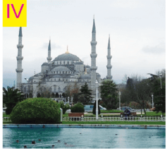
Sultan Ahmet Cami

Buna göre hangi numarayla gösterilen resim tarihi eser değildir ?