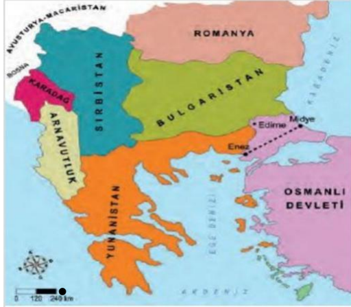
II. Balkan Savaşı sonrasında Balkanlar