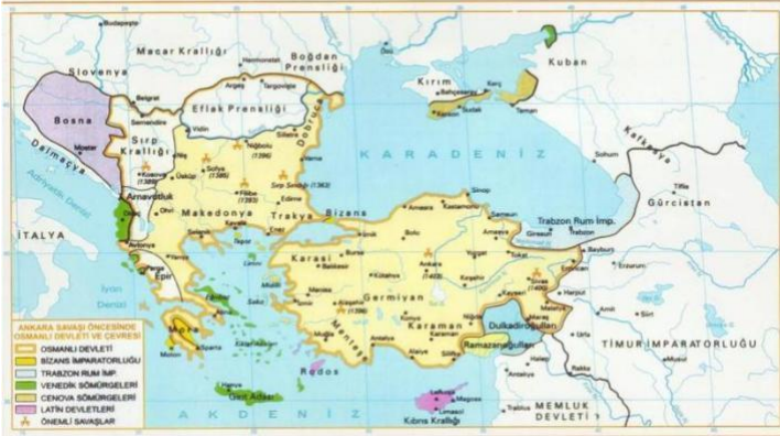
1402 YILINDA OSMANLI DEVLETİ