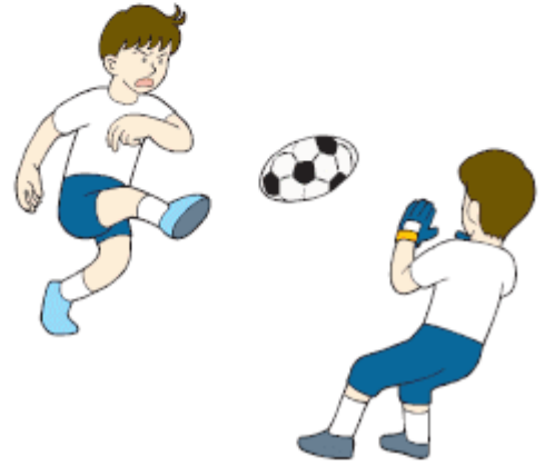
Maç yapan çocuklar