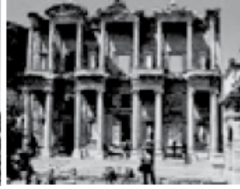
Efes Harabeleri İzmir

Görsellerde verilen tarihî ve doğal varlıkları koruma ve tanııtma, aşağıdaki bakanlıklardan hangisinin görev ve sorumluluk alanına girer?