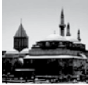
Mevlâna Türbesi Konya