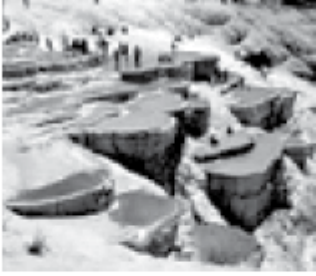
Pamukkale Travertenleri Denizli