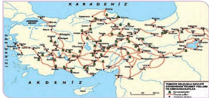
Harita 1.2: Türkiye Selçuklular Dönemi'nde Anadolu'daki başlıca ticaret yolları