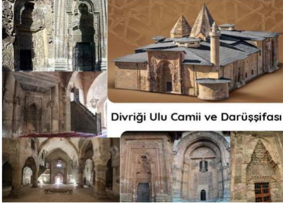
Divriği Ulu Camii ve Darüşşifası