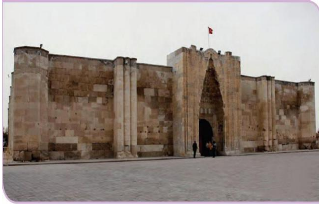
Görsel 1.15: Sultan Hanı - Aksaray