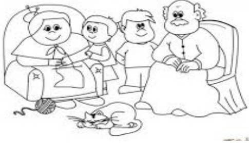
Dedem ile Ninem

1. Aşağıdaki metni okutunuz. Metin yazılmayacak.