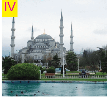
Sultan Ahmet Cami

Buna göre hangi numarayla gösterilen resim tarihi eser değildir ?