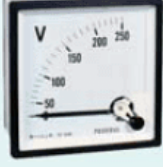
Elektrik akımı - V - volt