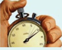
Zaman - t - saniye