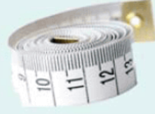
Uzunluk - L - metre