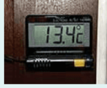
Sıcaklık - T - kelvin