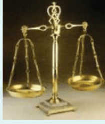
Kütle - m - kilogram

Buna göre, resimlerde gösterilen eşleştirmelerden kaç tanesi yanlıştır ?