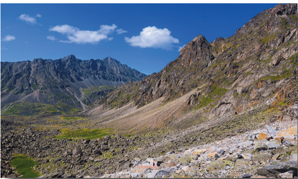
Kayaçlar doğa olaylarının etkisiyle ayrışır.

Doğal ortamları oluşturan unsurlar birbirleriyle sürekli etkileşim hâlinindedir. Doğal ortamlardaki bu etkileşim, dört ortamı oluşturan unsurlar arasında gerçekleşebildiği gibi iki farklı ortamı oluşturan unsurlar arasında hatta bir ortamın kendi unsurları arasında bile gerçekleşebilmektedir. Örneğin biyosferin bir unsuru olan bitkilerin yeryüzündeki doğal yaşam alanlarının ve özelliklerinin oluşmasında iklim koşulları, yer şekilleri, toprak yapısı, su varlığı gibi doğal unsurlar birlikte etkili olur. Litosferin bir unsuru olan kayaların atmosfer kökenli doğa olaylarının etkisiyle ayrışmalara maruz kalması, doğal ortamların etkileşiminin diğer bir örneğidir.