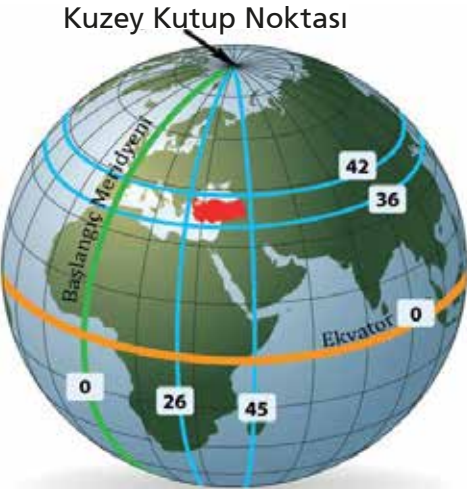
Şekil: Türkiye'nin Mutlak Konumu

Türkiye, 36° kuzey enlemi ile 42° kuzey enlemi arasında ve 26° doğu boylamı ile 45° doğu boylamı arasında yer alır.