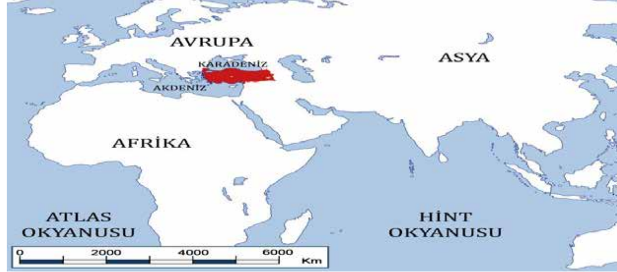
Harita: Türkiye'nin göreceli konumu

Türkiye, Kuzey Yarım Küre'de yer alır. Bu durum, Türkiye'nin güneyinden kuzeyine doğru gidildikçe bazı özelliklerin değişmesine neden olur. Bu özellikler şunlardır: