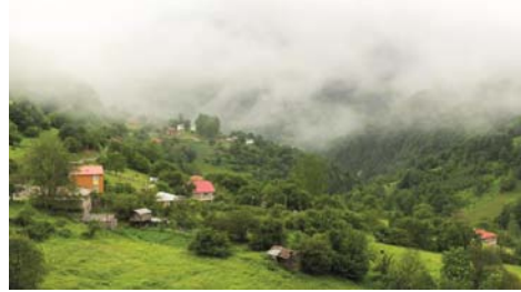
Dağınık yerleşme örneği

Su kaynaklarının ve yağışın fazla, yer şekillerinin engebeli, tarım arazisinin az ve parçalı olduğu bölgelerde evler birbirinden uzak ve mesafeli kurulmuştur. Bu tür yerleşme dokusuna dağınık yerleşme denir. Bu yerleşmelerde birbirinden uzak meskenler patika yollarla birbirine bağlanmıştır. Dağınık yerleşmeler Türkiye'de daha çok Karadeniz kıyı kuşağında dağ yamaçlarındaki kırsal kesimlerde görülür.