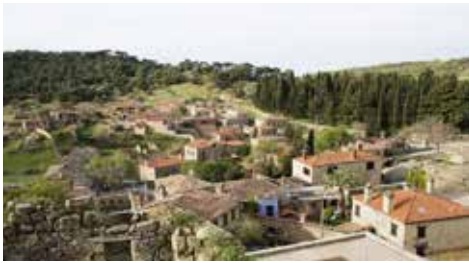
Toplu yerleşme örneği

Su kaynaklarının sınırlı ve yetersiz, engebenin az olduğu kurak ve yarı kurak iklim bölgelerindeki kırsal alanlarda evler birbirine yakındır. Bu tür yerleşme dokusuna toplu yerleşme denir. Bu yerleşmelerde meskenler birbirine bitişik ya da çok yakındır ve sokaklar dardır. Toplu yerleşmeler Türkiye'de İç Anadolu, Güneydoğu ve Doğu Anadolu'nun kırsal kesimlerinde görülür.