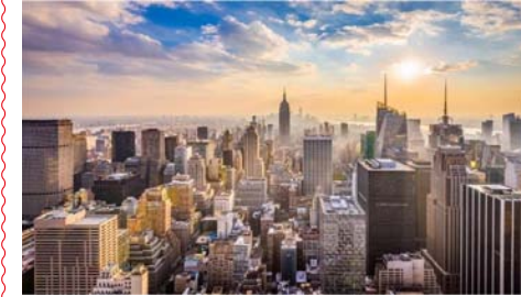
Şehir yerleşmesi örneği

Şehir yerleşmeleri; sanayi ve ticaret gibi tarım dışı faaliyetlerin ön plana çıktığı, nüfusu genellikle 20.000'in üstünde olduğu yerleşmelerdir. Şehirlerde genellikle planlı bir yerleşme görülür. Kalabalık nüfusun ihtiyaçlarına yönelik meslek ve iş kolu çeşitliliği fazladır. Şehir yerleşmeleri, nüfuslarına ve fonksiyonlarına göre sınıflandırılabilir.