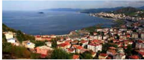
Çizgisel yerleşme örneği

Deniz kıyısı, akarsu vadisi ve yol boyunca uzanan yerleşmeler çizgisel bir hat oluşturur. Bu tür yerleşme dokusuna çizgisel yerleşme denir. Dünya üzerinde akarsu boyunca çizgisel uzanan birçok yerleşme alanı bulunur. Dağların kıyıya paralel uzandığı Türkiye'nin Karadeniz kıyılarındaki il, ilçe ve köyler genellikle çizgisel yerleşme dokusuna sahiptir.