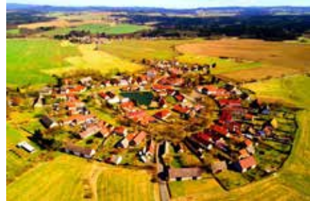
Dairesel yerleşme örneği

Genellikle geniş bir düzlüğün ortasında yer alan yerleşmeler dairesel bir gelişme gösterir. Bu tür yerleşme dokusuna dairesel yerleşme denir. Köylerde okul, cami ve meskenlerin bir arada olduğu köy meydanlarının etrafında gelişen köy yerleşmeler dairesel dokuludur. Düz arazilerde kurulan ve birkaç farklı yönden ulaşım bağlantısı olan şehirler de genellikle dairesel bir yerleşme dokusuna sahiptir.